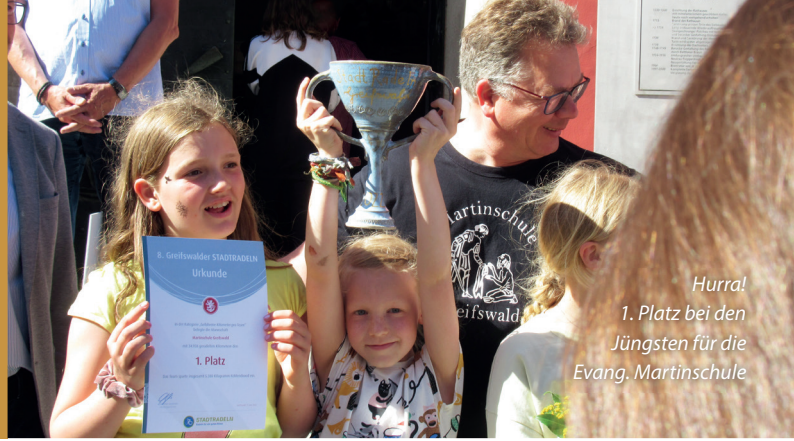
Hurra! 1. Platz bei den Jüngsten für die Evang. Martinschule

Siegerehrung war 13. Juni vor dem Rathaus